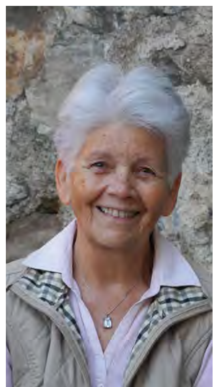
Un beau sourire pour les malades.

Actuellement, quatorze personnes (certaines étaient déjà là au tout début) consacrent leur jeudi après-midi à cette tâche. Un tournus est établi.