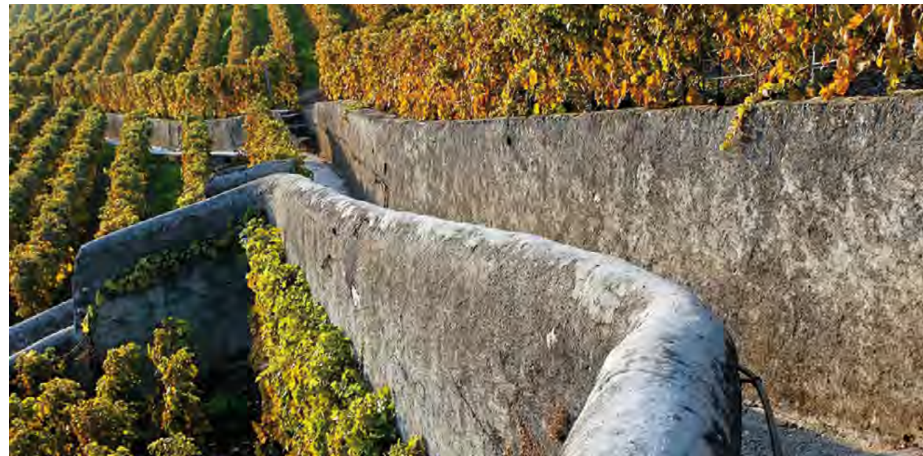
Après les vendanges, en attendant la neige...

La Commune est propriétaire de grandes surfaces viticoles que nous présenterons plus en détail dans un prochain numéro de la feuille . Aujourd'hui, non sans une certaine nostalgie, nous prenons congé de deux fidèles collaborateurs et en accueillons un nouveau.