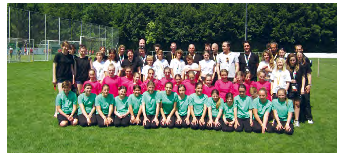
Une forte délégation de gymnastes de Bourg-en-Lavaux.

Les 15 et 16 juin dernier, la Fédération Suisse de Gymnastique de Cully a rejoint les 17000 jeunes qui ont participé à la fête fédérale de gym. Organisée tous les 6 ans, cette grande aventure avait lieu à Bienne.