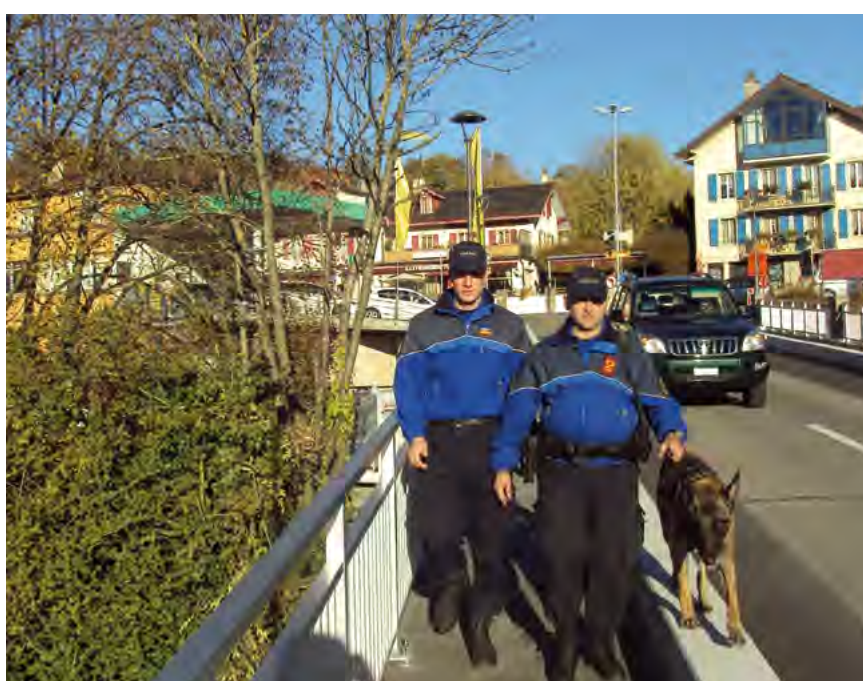
«Protéger et servir», devise de l'APOL.

En septembre 2009, le choix du peuple s'est porté sur une police de proximité, basée sur la coexistence entre police régionale et cantonale. Depuis janvier 2012, l'APOL (Association Police Lavaux) a ainsi repris le contrat de la prévention, de l'administration et de la répression dans notre région. Cette nouvelle organisation n'a pas été choisie au hasard : elle permet une meilleure sécurité, en privilégiant une coordination et une cohérence dans l'intervention policière.