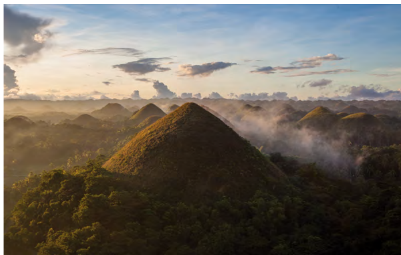
Les collines de chocolat, Philippines

Lucas Veuve, photographe autodidacte de voyage et humanitaire, expose ses photographies à l'hôpital de Lavaux du 26 mai au 27 juillet. Pour sa première exposition en Suisse, Lucas Veuve pré-