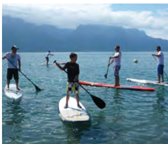
Stand Up Paddle, Lavaux (page 9)