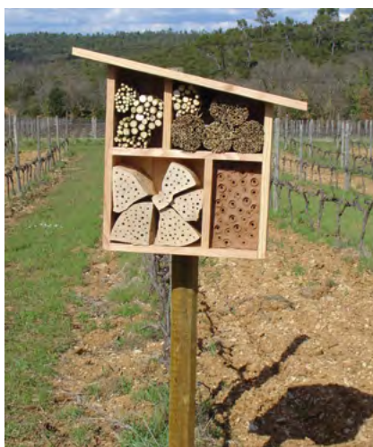
Hôtel pour abeilles

Forte du succès de l'année passée, la commission prépare une nouvelle édition de la fête de la mobilité qui aura lieu du 16 au 22 septembre 2013. Outre la journée à pied à l'école, différentes actions seront organisées sur